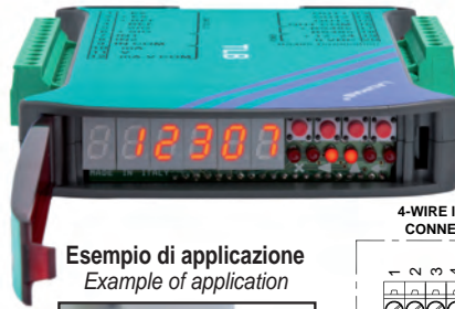
Esempio di applicazione Example of application