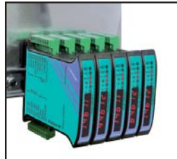
Esempio di applicazione Example of application

PG A richiesta on request GOST R Russian Standards