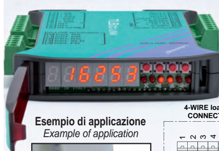
Esempio di applicazione Example of application